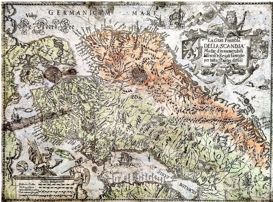
Äldsta kartan över Skandinavien 1664